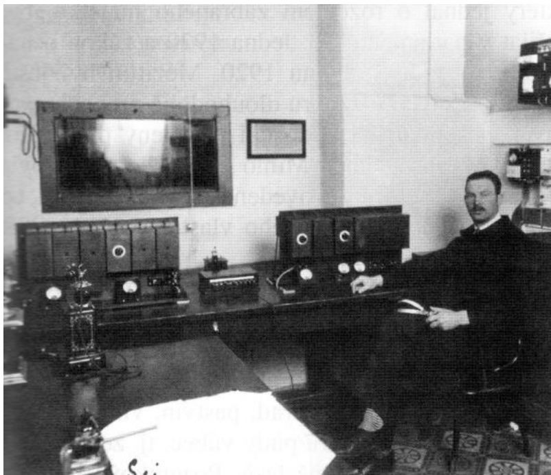
Obrázek 4 - Hlasatelna brněnského studia Radiojournalu (1928)