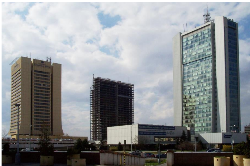
Obrázek 7 - Mrakodrapy na Pankráci v roce 2006, uprostřed nedostavěná budova Československého rozhlasu

Roku 1986 zahájila provoz hudební stanice Melodie a roku 1989 stanice pro mladé posluchače EM. Právě na EM se poprvé v Československém rozhlasu objevily 20. listopadu 1989 zprávy popisující průběh událostí ze 17. listopadu toho roku. Rozhlasoví pracovníci se následně přidali k protestům sametové revoluce. Po pádu komunistického režimu došlo k výrazným personálním i programovým změnám. Ještě na konci roku 1989 byl okruh Hvězda přejmenován na stanici Československo. Koncem roku 1990 zanikl v Česku okruh EM, zatímco na Slovensku se z něj stala stanice Elán. Na počátku roku 1991 začala fungovat regionální stanice Regina. Dne 1. července 1991 vznikl samostatný veřejnoprávní Slovenský rozhlas (SRo), obdobně vznikl k 1. lednu 1992 veřejnoprávní Český rozhlas (ČRo). Československý rozhlas od počátku roku 1992 provozoval celostátní federální stanici Československo a zahraniční vysílání, zatímco pod oba národní rozhlas spadaly zbylé okruhy již dříve rozdělované dle národního principu. Vzhledem k zániku