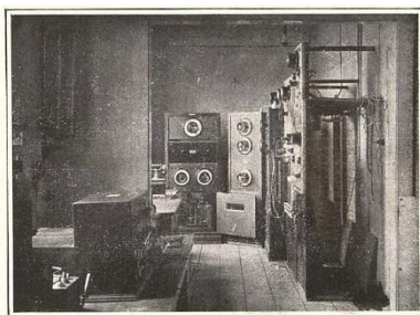
VNITŘEK KBELSKÉ STANICE.