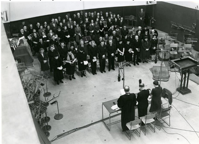
Obrázek 6 - Rozhlasová boboslužba v roce 1941

Nacisté usilovali jak o vliv nad vysíláním, tak o aktiva rozhlasové společnosti. Ta byla od 1. dubna 1940 součástí německé Reichs-Rundfunk-Gesellschaft (RRG), od 15. listopadu 1941 pak byla coby Rundfunk Böhmen und Mähren přímou součástí tohoto říšského rozhlasu. Nacisté měli od října 1940 své zástupce v radách společnosti, 49 % kapitálu držel úřad protektora a 51 % pak protektorátní vláda. Na jaře 1942 došlo ke změně, kdy byl celý kmenový kapitál ve výši 1 milionu Kč postoupen RRG.