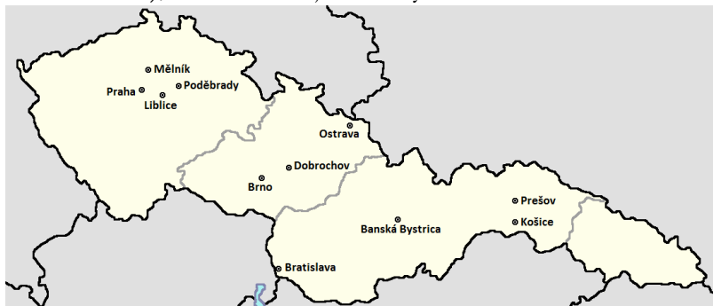
Obrázek 2 - Umístění rozhlasových vysílačů ve 30. letech 20. století

přemístilo do Národního domu na Mírovém náměstí (dnešní náměstí Míru), odkud Radiojournal vysílal do roku 1933.