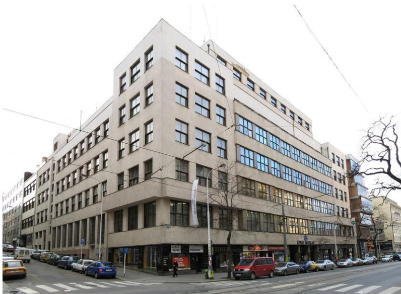
Obrázek 3 - Hlavní budova někdejšího Radiojournalu v Praze ve Vinohradské ulici

Již v září 1924 zahájil Radiojournal vysílání z Brna, v říjnu 1926 z Bratislavy, v dubnu 1927 z Košic a v červenci 1929 z Moravské Ostravy.